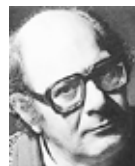
Mauricio Kagel compositeur

http://www.moderecords.com/catalog/127kagel.html