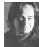
Maurizio Pisati compositeur