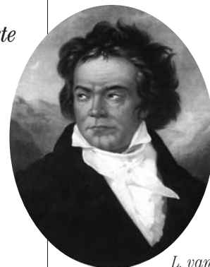
L. van Beethoven