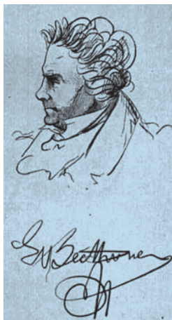
L. van Beethoven