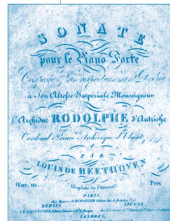
L. van Beethoven