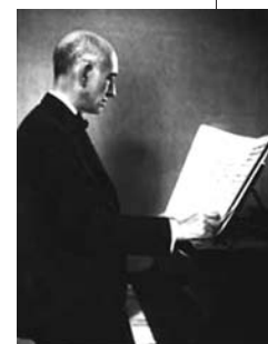
M. De Falla